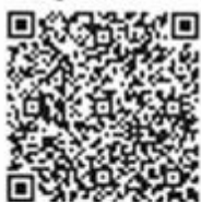
Jefe de productos digitales Servicio Nacional de Migraciones